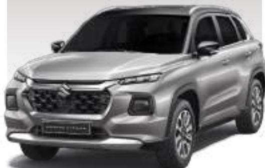
GRIS PLATA TECHO NEGRO