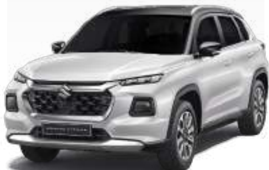
BLANCO TECHO NEGRO